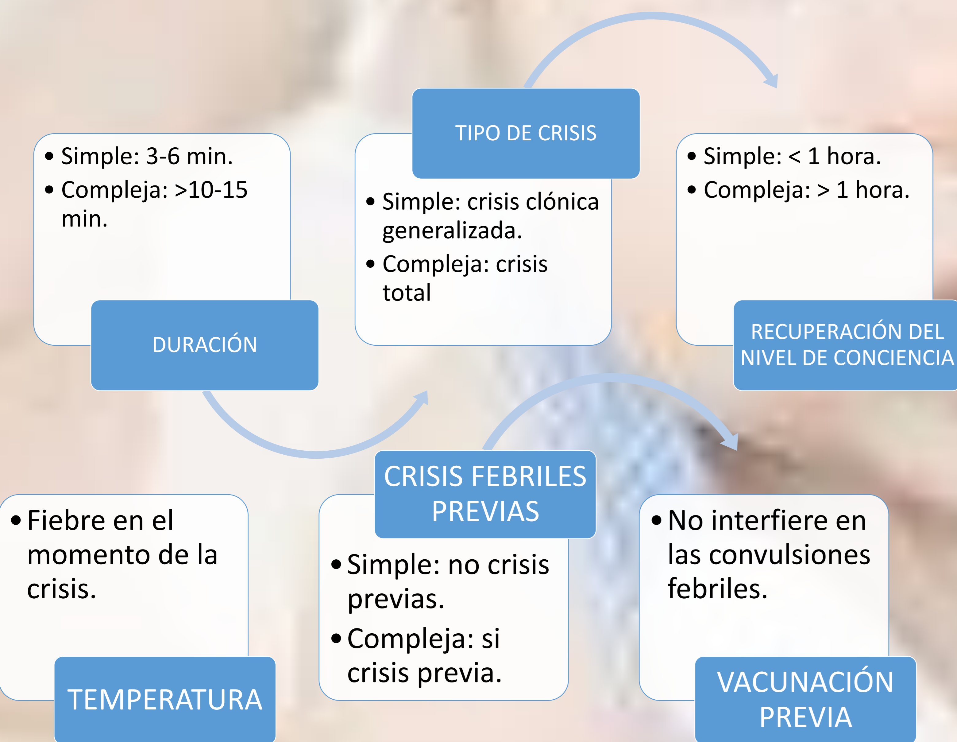
Gráfico 1. Características de las convulsiones febriles